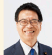
参議院議員 しまぐち 誠

CNDから各議員へと 困りごとを届けます。 困りごとやご意見・ ご要望はこちらから！