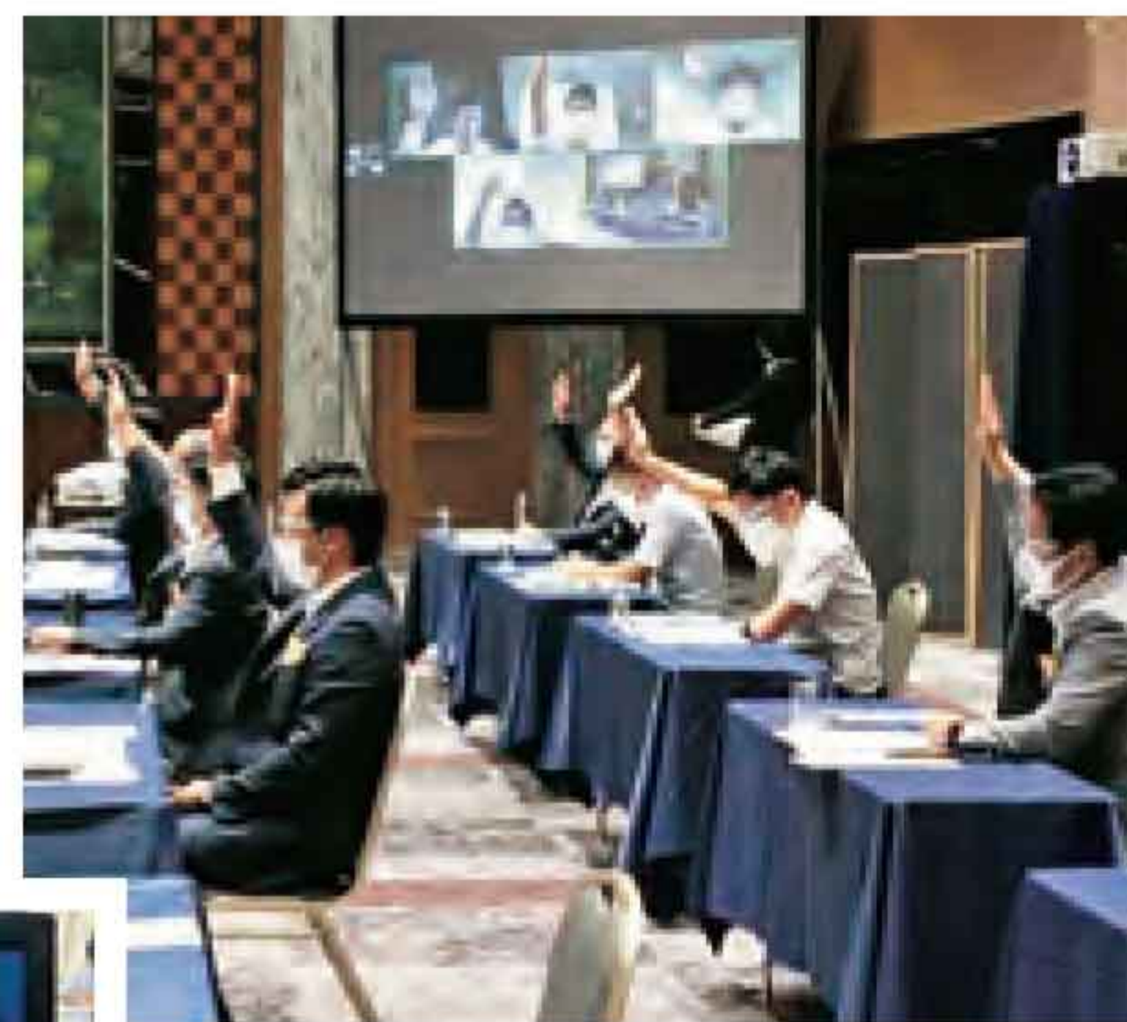
① 審議に参加する代議員のみなさん ② 加盟組合のみなさんはPCで傍聴